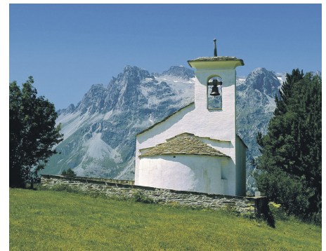
Kirche Fex Crasta